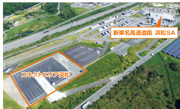
写真-2 コネクトエリア浜松

——コネクトエリア浜松は、新東名の浜松SAに隣接し、セミトレーラーが停車可能な4m×20mでバースを設定、東京～大阪間の中継拠点としてドライバーが交替する、またはヘッド交換により積荷を交換する施設で、労働時間短縮、労働負担軽減など労働環境の改善等、働き方改革につながるものとして期待されています。参考までに、東京、大阪からコネクトエリア浜松までの距離と時間は、東京IC～浜松間が約224km（約2時間48分）、大阪（吹田IC）～浜松間が約246km（約3時間5分）で、ドライバーが日帰りで勤務できます。