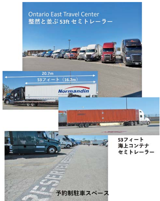
写真-1 整然と並ぶ53ftセミトレーラー (ロサンゼルス郊外の大型車駐車センター)

最近では、小売大手ウォルマート、IT大手アマゾンなどが53ft海上コンテナを自ら保有し、中国との貿易に利用しようとしています。以前は、40ft海上コンテナから53ftセミトレーラーに積み替えて国内輸送をしていましたが、今後は、積み替えの必要がない53ft海上コンテナの活用が進むと思われます。